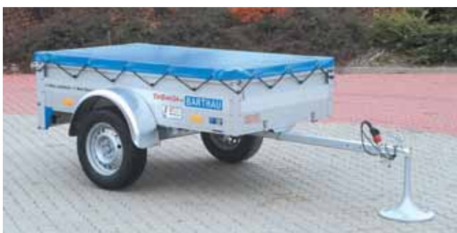
QL 751 mit Zubehör: Flachplane, serienmäßig in hellgrau, andere Farben gegen Mehrpreis lieferbar.