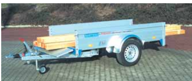
QL 1351 beladen: Vordere und hintere Bordwand abgeklappt.

Der Lastenträger ist über die Ladungssicherung TOPZURR24 befestigt und kann so kinderleicht auf- und abmontiert werden, ohne den Anhängerboden zu beschädigen. Zum Fahrradtransport ist der Fahrradträger auf den Lastenträger aufgesetzt. Maximal 5 Fahrräder finden darauf Platz.